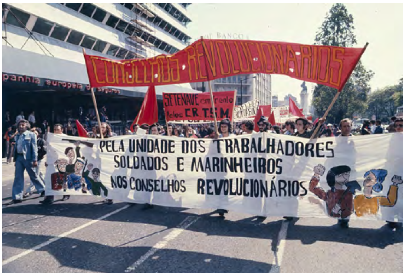
Figura 38 [Manifestação política]. Diapositivo cromogéneo em acetato de celulose, 35mm (caixilho).

Avenida Fontes Pereira de Melo (Lisboa), [post. 1974]. José Ernesto de Sousa (1921-1988). PT/AMLSB/ESO/001177