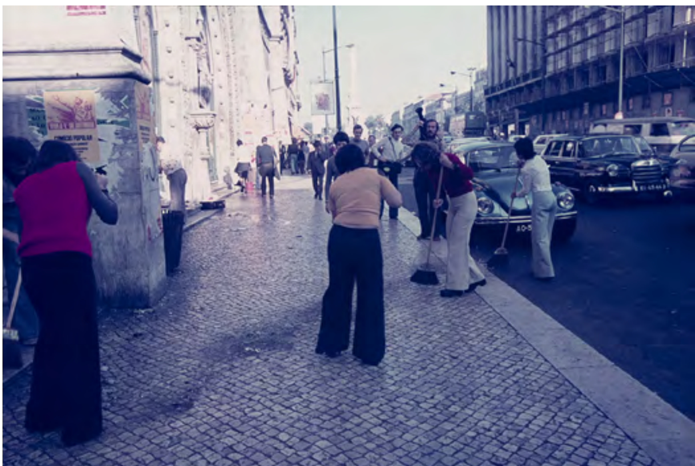
Figura 37 [Limpeza do passeio junto à entrada da estação de comboios do Rossio, no dia de trabalho nacional]. Diapositivo cromogéneo em acetato de celulose, 35mm (caixilho). Praça Dom João da Câmara (Lisboa), [1974-10-06].