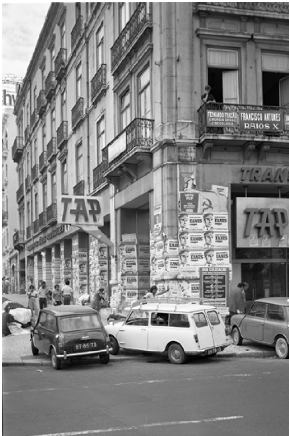
Figura 1 [Propaganda política]. Negativo de gelatina e prata em acetato de celulose, 6x9 cm.

Praça Marquês de Pombal (Lisboa), 1976. Álvaro Campeão (s.d.). PT/AMLSB/CMLSBAH/PCSP/004/CAM/000041