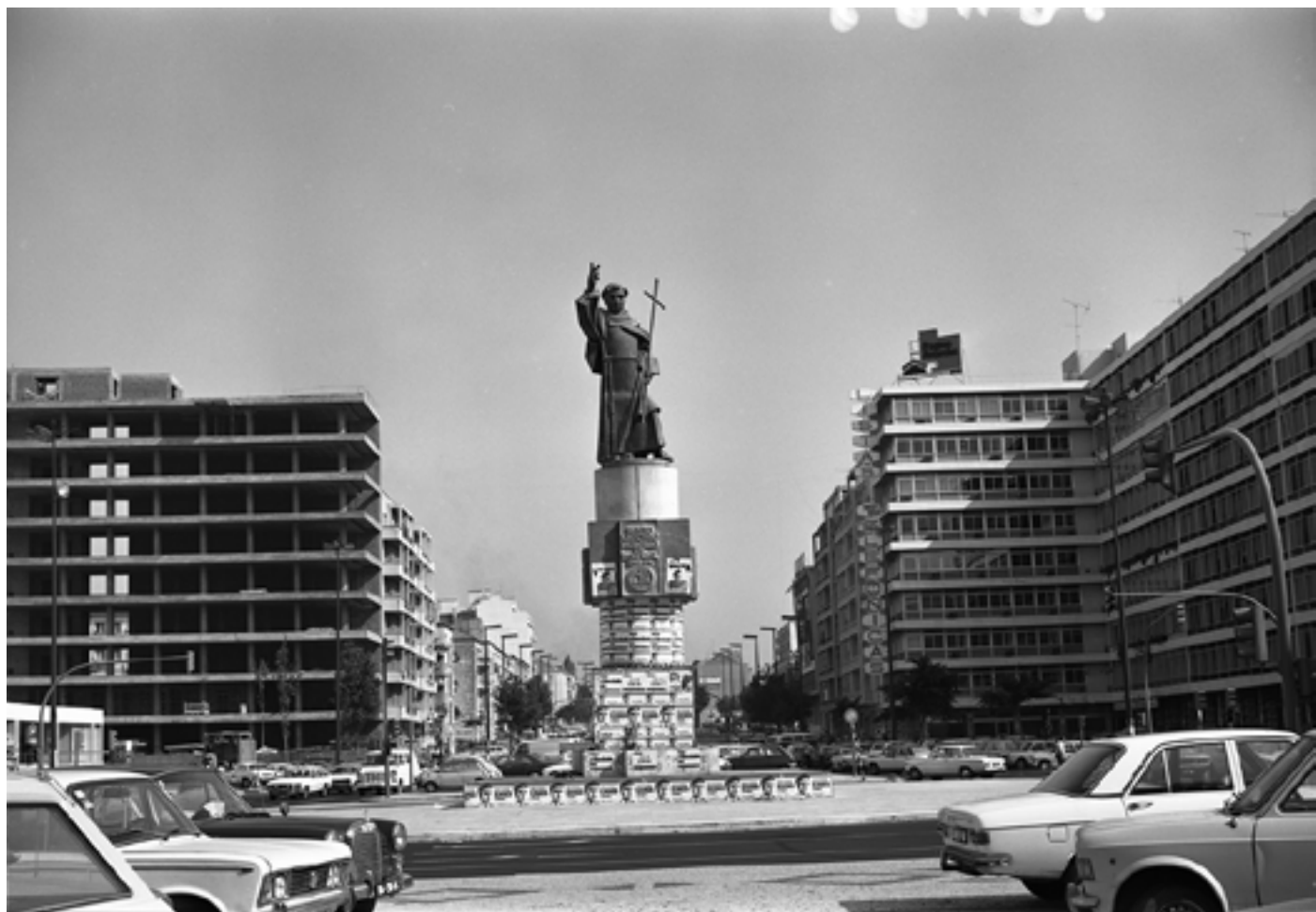
Figura 6 [Propaganda política no monumento a Santo António]. Negativo de gelatina e prata em acetato de celulose, 6x9 cm.

Praça de Alvalade (Lisboa), 1976. Álvaro Campeão (s.d.). PT/AMLSB/CMLSBAH/PCSP/004/CAM/000014