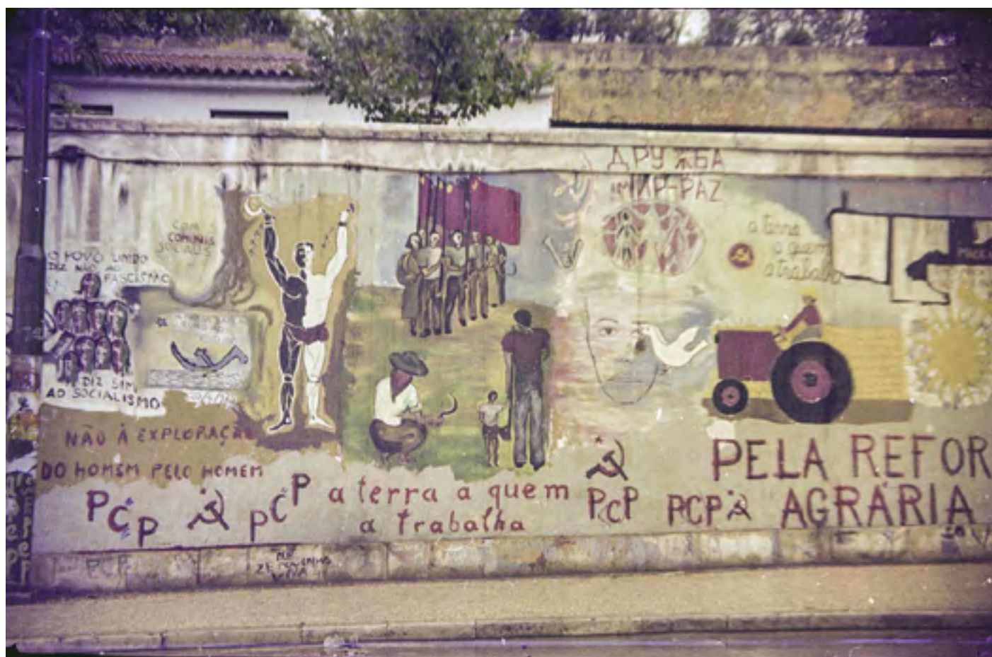
Figura 50 [Propaganda política, mural]. Negativo cromogéneo em acetato de celulose, 35mm em tira.