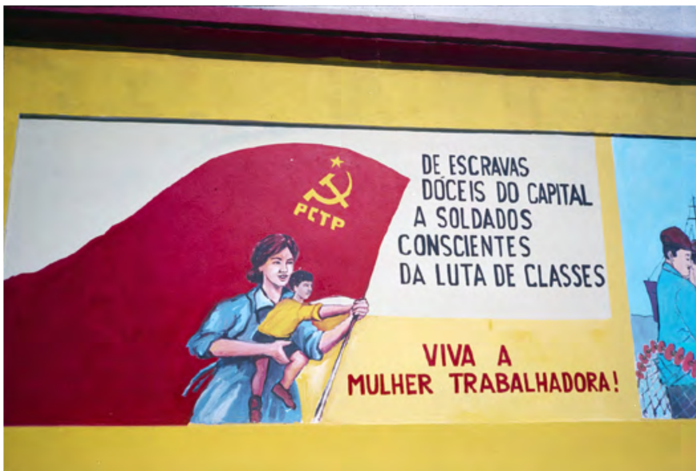
Figura 48 [Propaganda política: mural]. Negativo cromogéneo em acetato de celulose, 35mm em tira.