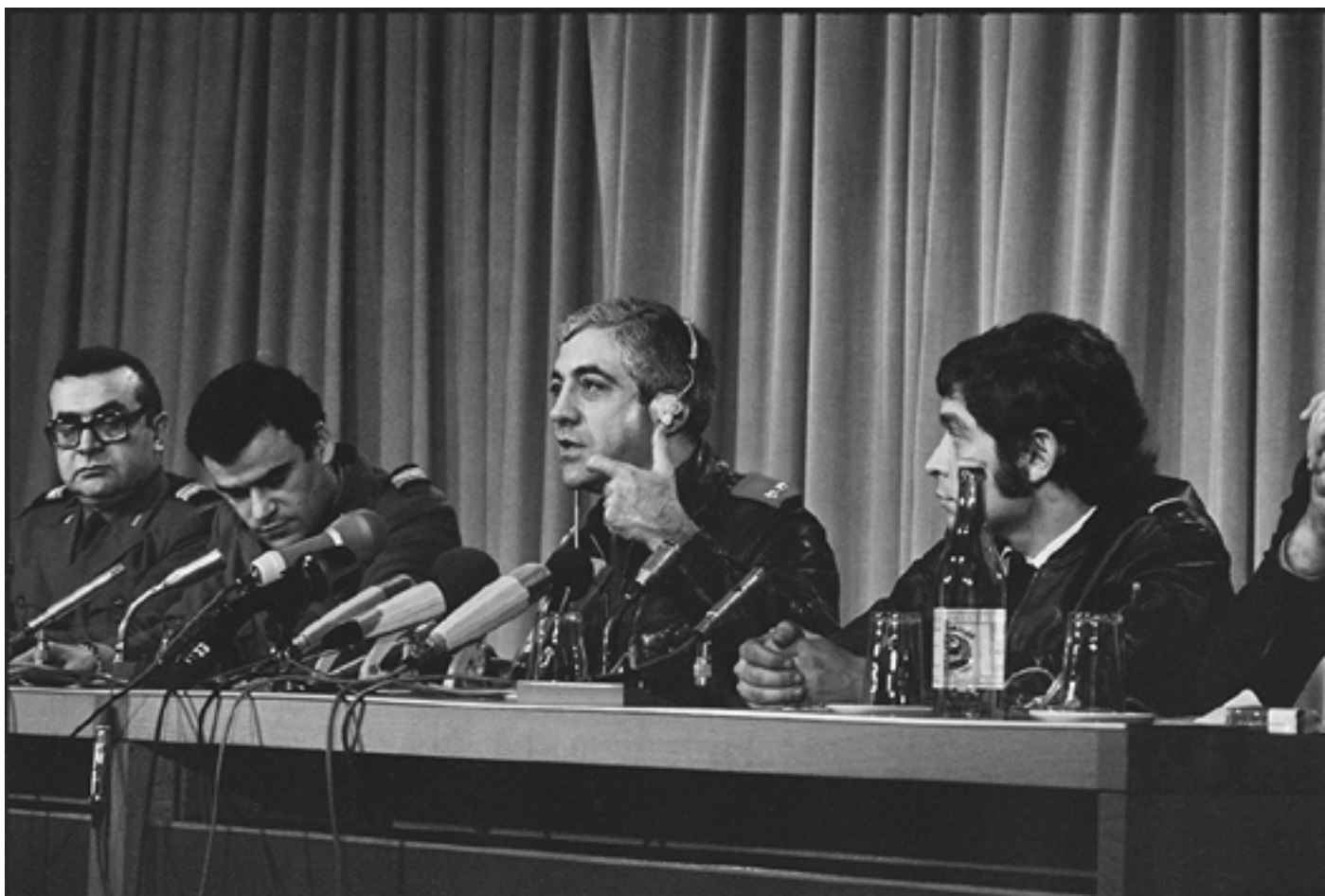
Figura 26 [Conselho da Revolução no Centro Eleitoral da Fundação Calouste Gulbenkian: conferência de imprensa de Otelo Saraiva de Carvalho].

Negativo de gelatina e prata em acetato de celulose, 35mm em tira.