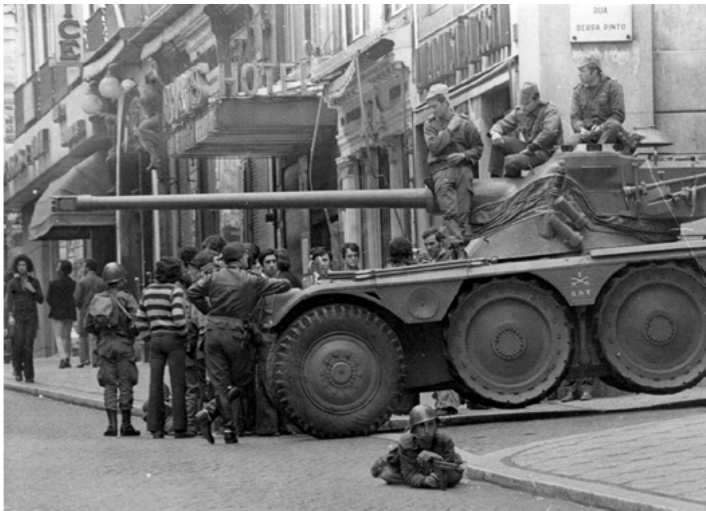
Figura 20 Revolução de 25 de Abril de 1974. Prova em papel de revelação baritado, 12,5x17,5cm.

Rua Garret (Lisboa), 1974-04-25. Jornal Diário de Notícias . PT/AMLSB/CMLSBAH/PCSP/004/JDN/000104