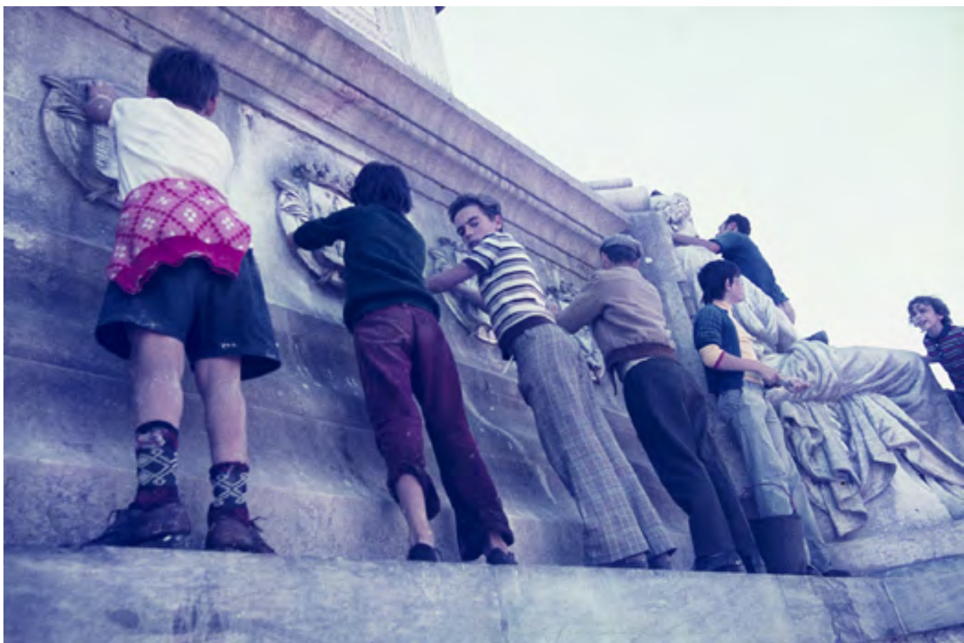
Figura 36 [Crianças colaboram na limpeza do monumento a Dom Pedro IV, no dia de trabalho nacional]. Diapositivo cromogéneo em acetato de celulose, 35mm (caixilho). Praça de Dom Pedro IV (Lisboa), [1974-10-06].