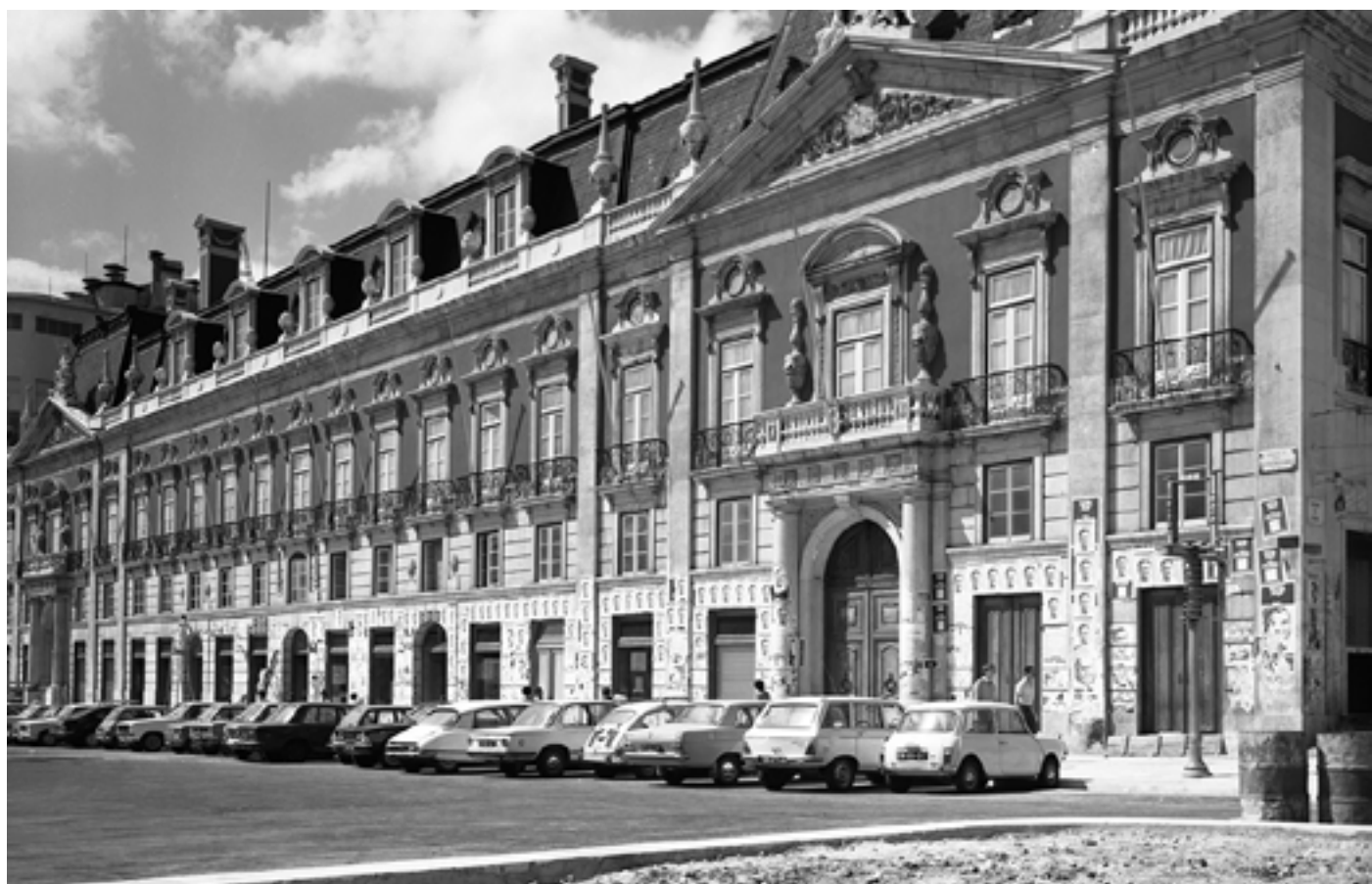
Figura 3 [Propaganda política no Palácio Foz]. Negativo de gelatina e prata em acetato de celulose, 6x9 cm.

Praça dos Restauradores (Lisboa), 1976. Álvaro Campeão (s.d.). PT/AMLSB/CMLSBAH/PCSP/004/CAM/000033