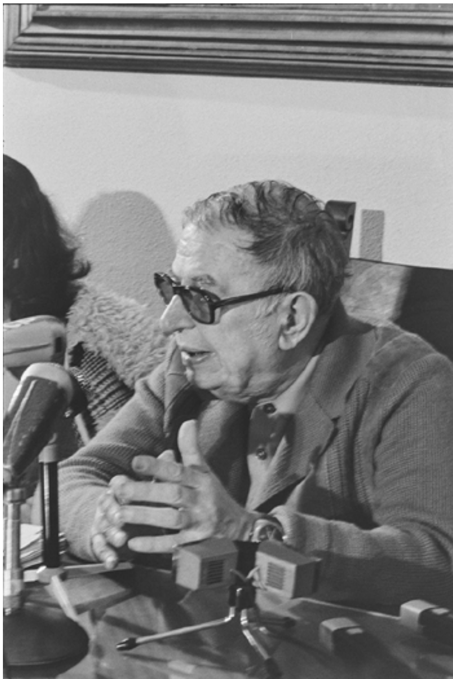
Figura 29 [Conferência de imprensa de Jean Paul-Sartre no Sindicato dos Jornalistas]. Negativo de gelatina e prata em acetato de celulose, 35mm em tira.

Lisboa, 1975-04-04. José Couto Nogueira (1945-). PT/AMLSB/JCN/002634