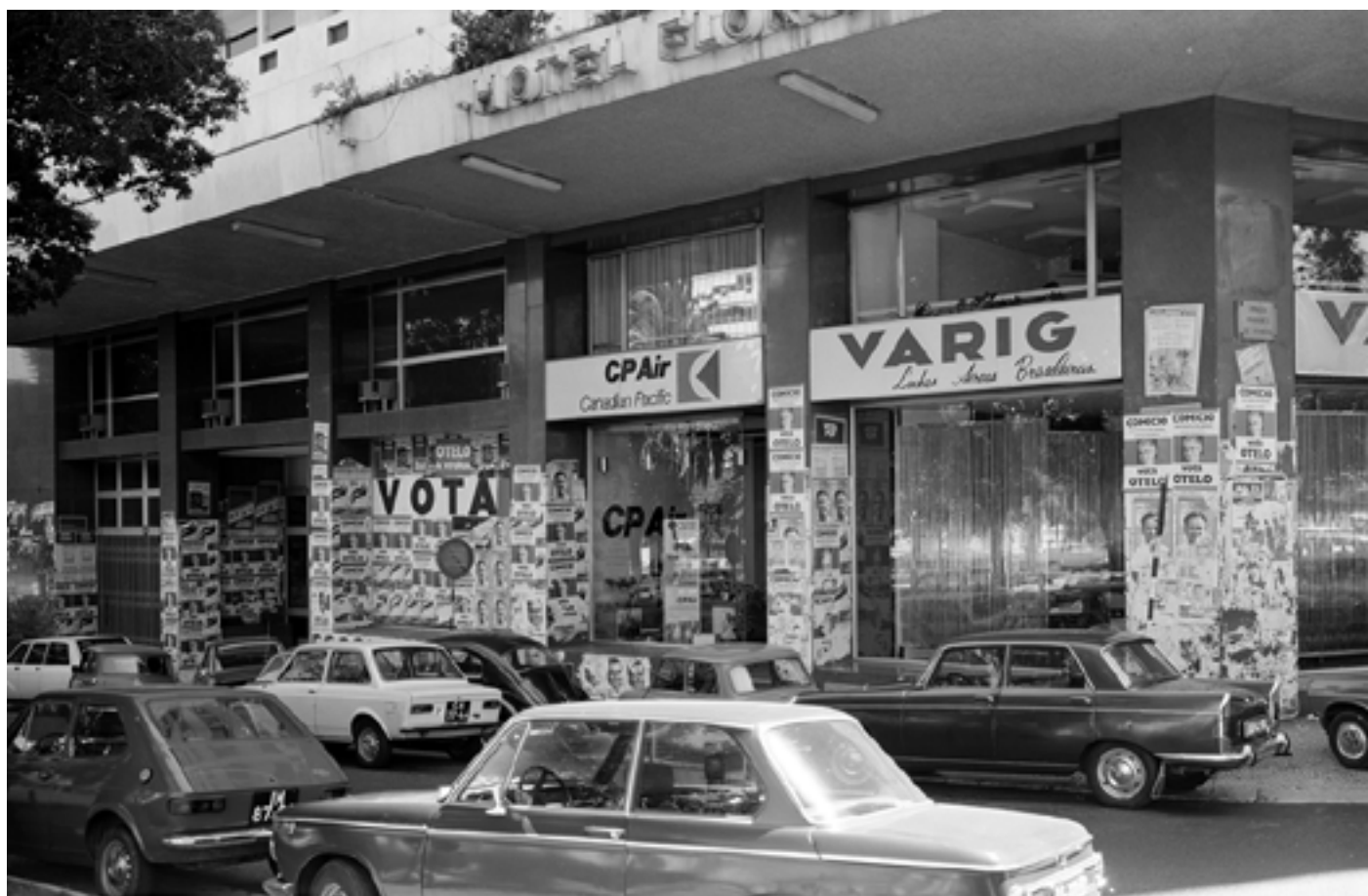
Figura 2 [Propaganda política]. Negativo de gelatina e prata em acetato de celulose, 6x9 cm.

Avenida da Liberdade com a praça Marques de Pombal (Lisboa), 1976. Álvaro Campeão (s.d.). PT/AMLSB/CMLSB/PCSP/004/CAM/000040