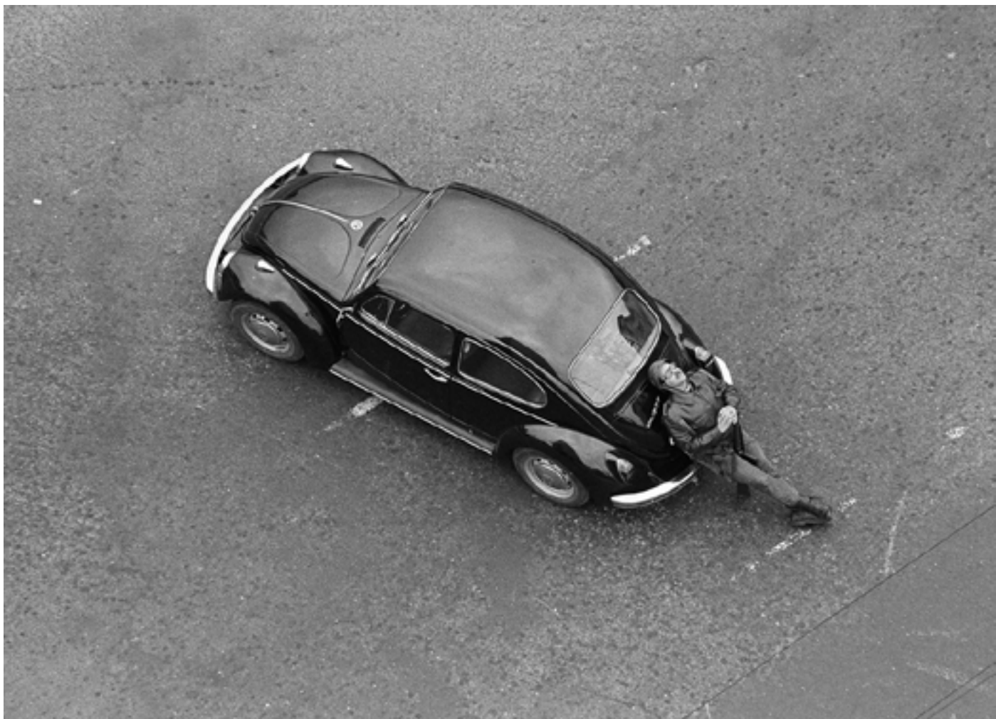
Figura 45 Cruzamento de São Sebastião da Pedreira. Negativo de gelatina e prata em acetato de celulose.

Lisboa, 1974-04-25. Luis Pavão (1954-). PT/AMLSB/LUP/000001