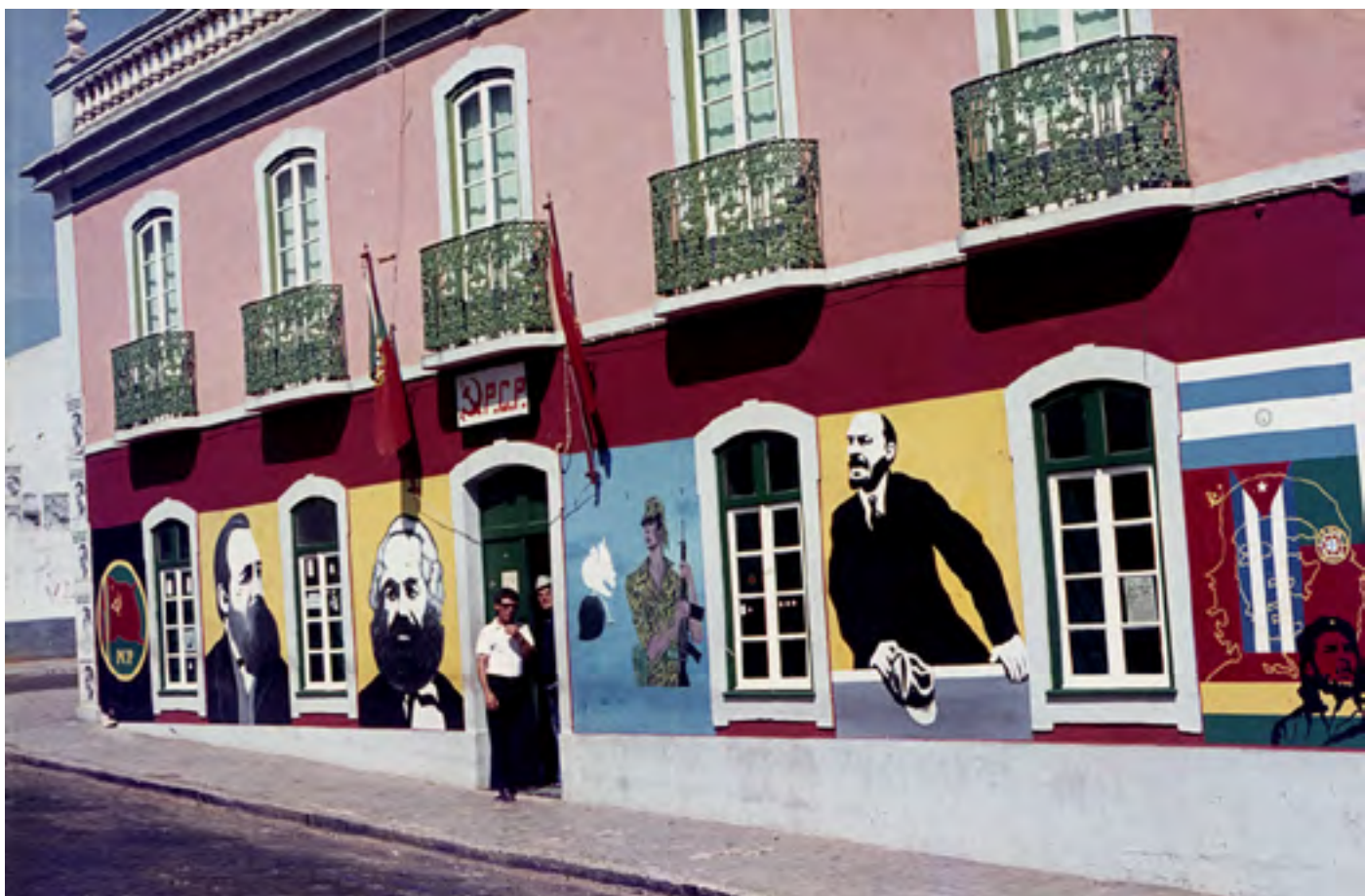
Figura 43 Mural na fachada da sede do PCP. Diapositivo de gelatina e prata em acetato de celulose, 35mm.

Aljustrel, 1976. José Neves Águas (1920-1991). PT/AMLSB/NEV/01/000953