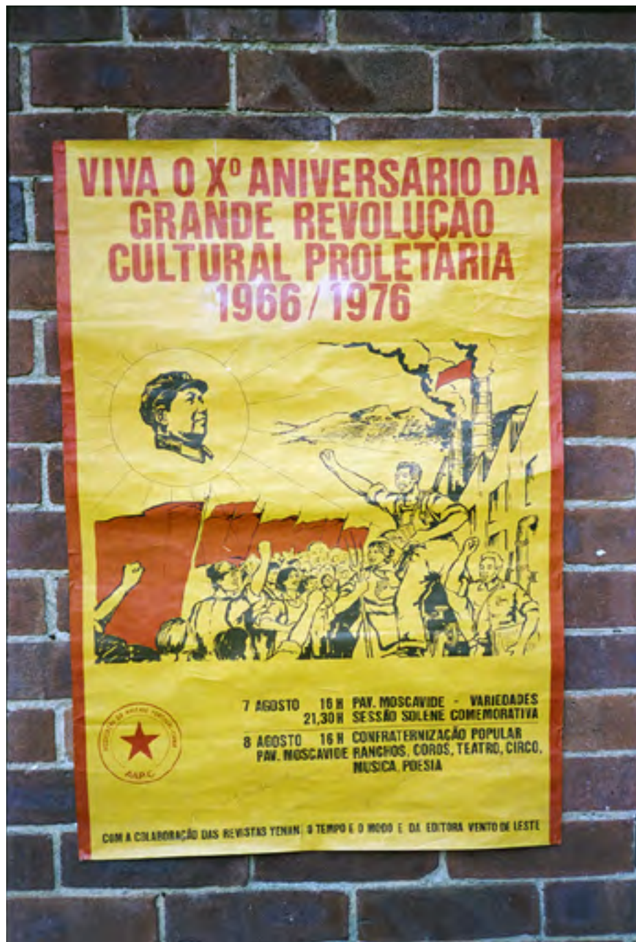
Figura 49 [Propaganda política: cartaz]. Negativo cromogéneo em acetato de celulose, 35mm em tira.