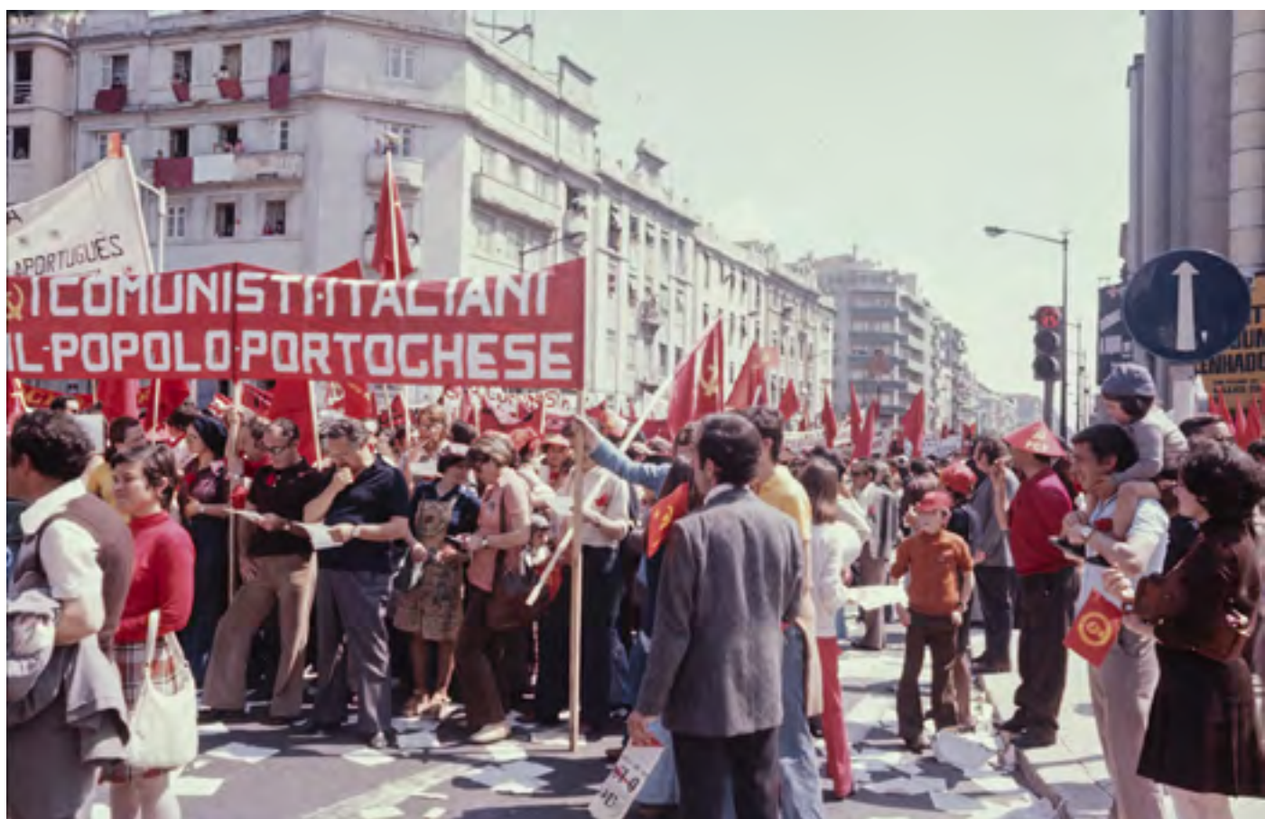
Figura 41 [Manifestação política]. Diapositivo cromogéneo em acetato de celulose, 35mm (caixilho).

Alameda Dom Afonso Henriques (Lisboa), [post. 1974]. Ernesto de Sousa (1921-1988). PT/AMLSB/ESO/001030