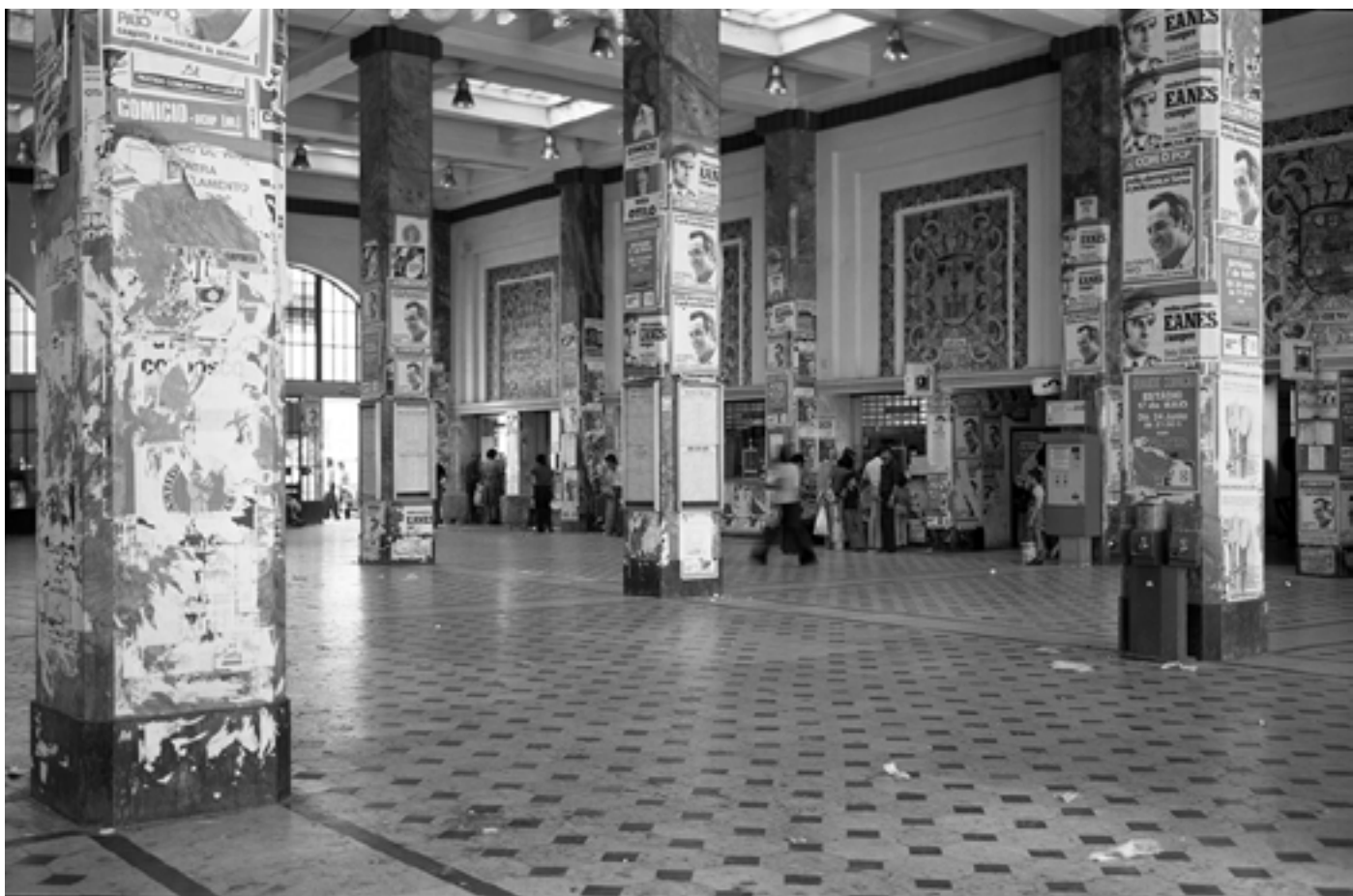
Figura 5 [Propaganda política no interior da estação fluvial de Sul e Sueste]. Negativo de gelatina e prata em acetato de celulose, 6x9 cm.

Avenida Infante Dom Henrique. (Lisboa), 1976. Álvaro Campeão (s.d.). PT/AMLSB/CMLSBAH/PCSP/004/CAM/000023