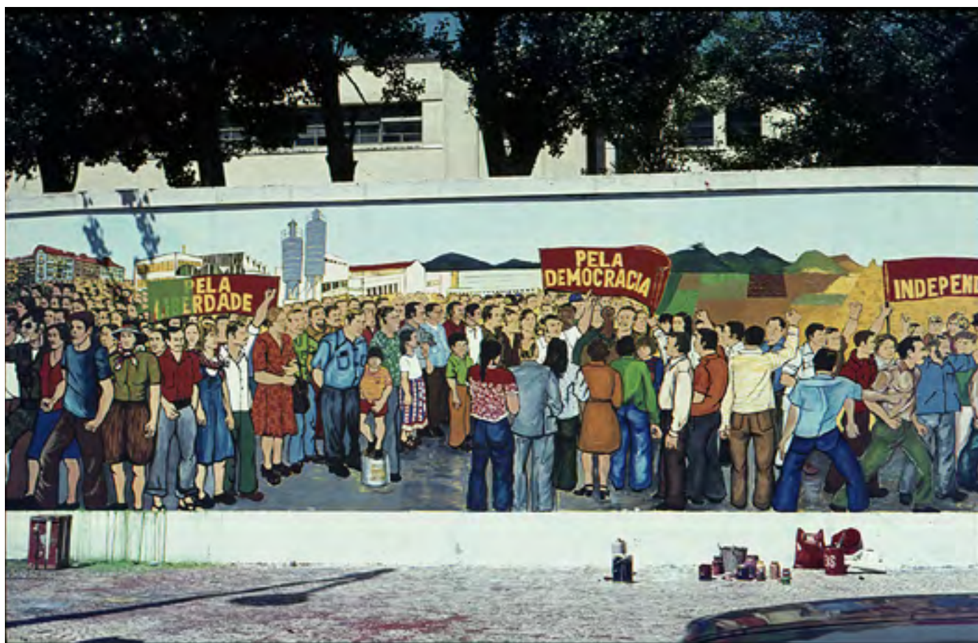
Figura 44 Mural de propaganda eleitoral a Ramalho Eanes. Diapositivo de gelatina e prata em acetato de celulose, 35mm.

Avenida Manuel da Maia (Lisboa), 1976. José Neves Águas (1920-1991). PT/AMLSB/NEV/01/000950