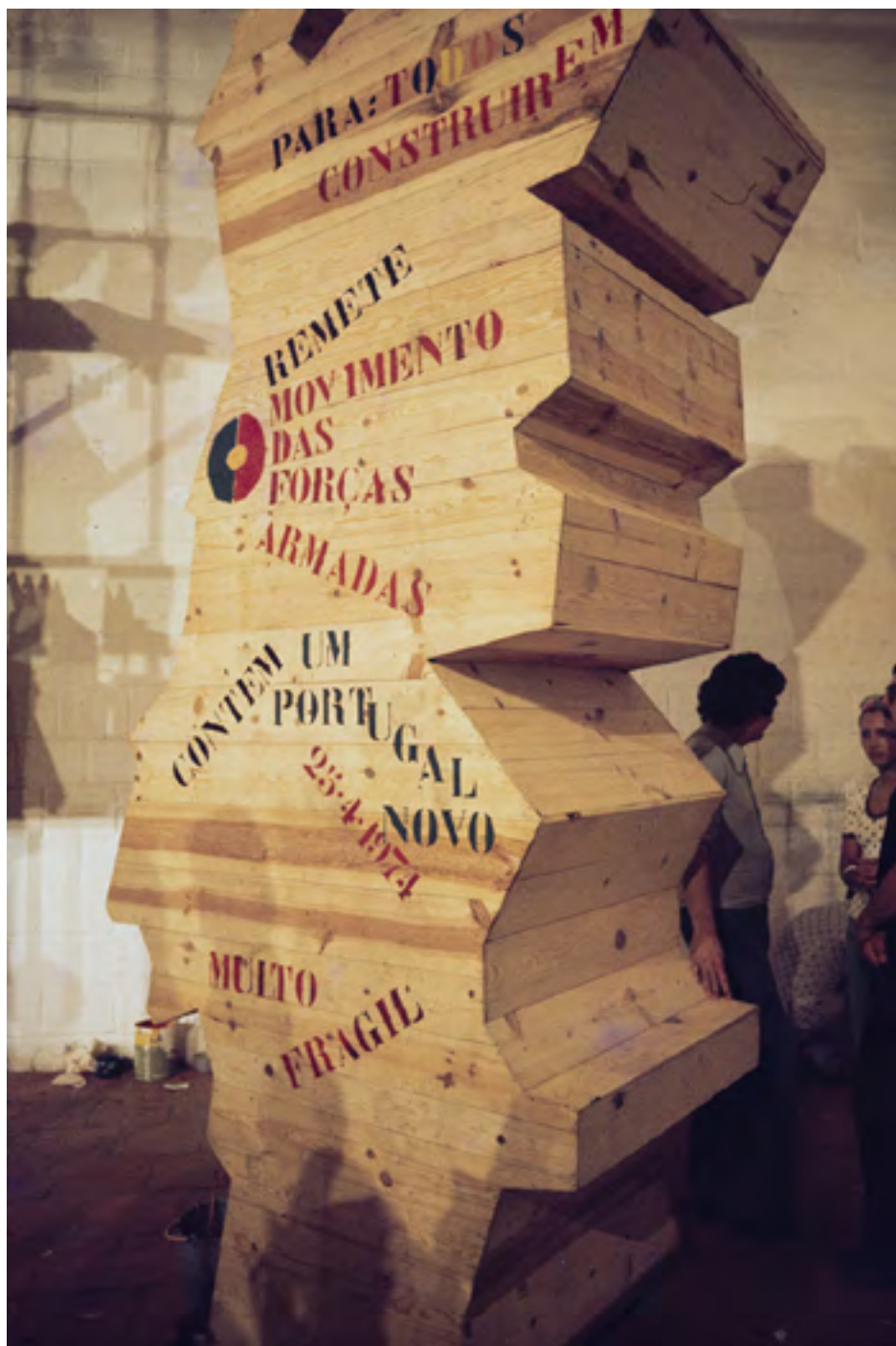
Figura 35 [Festa comemorativa do 10 de Junho: obra em madeira do artista José Aurélio]

Diapositivo cromogéneo em acetato de celulose, 35mm (caixilho).