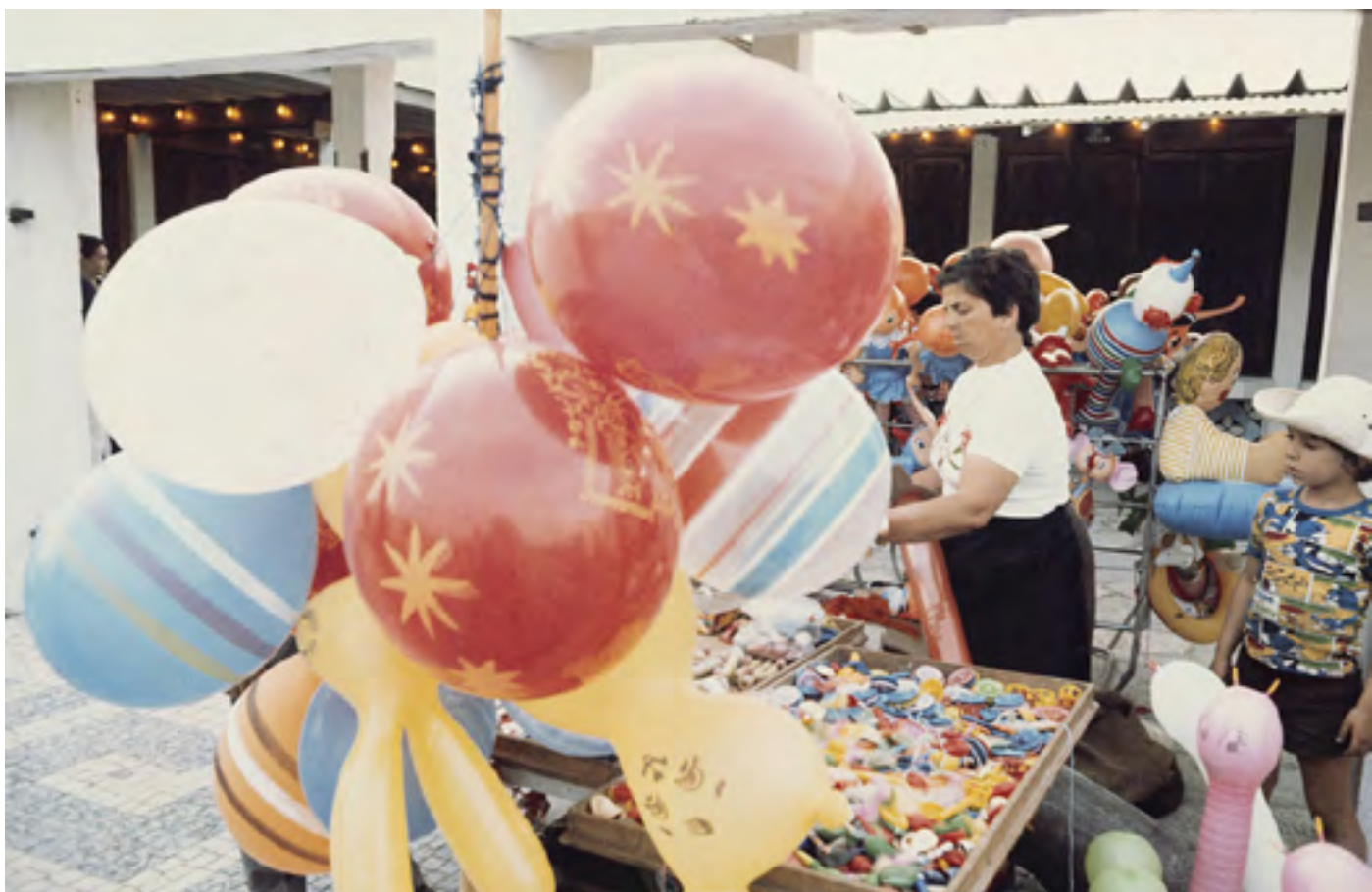
Figura 33 [Festa comemorativa do 10 de Junho no Mercado do Povo: vendedora de balões junto ao Museu de Arte Popular]. Diapositivo cromogéneo em acetato de celulose, 35mm (caixilho). Lisboa, 1974-06-10. José Ernesto de Sousa (1921-1988). PT/AMLSB/ESO/001613