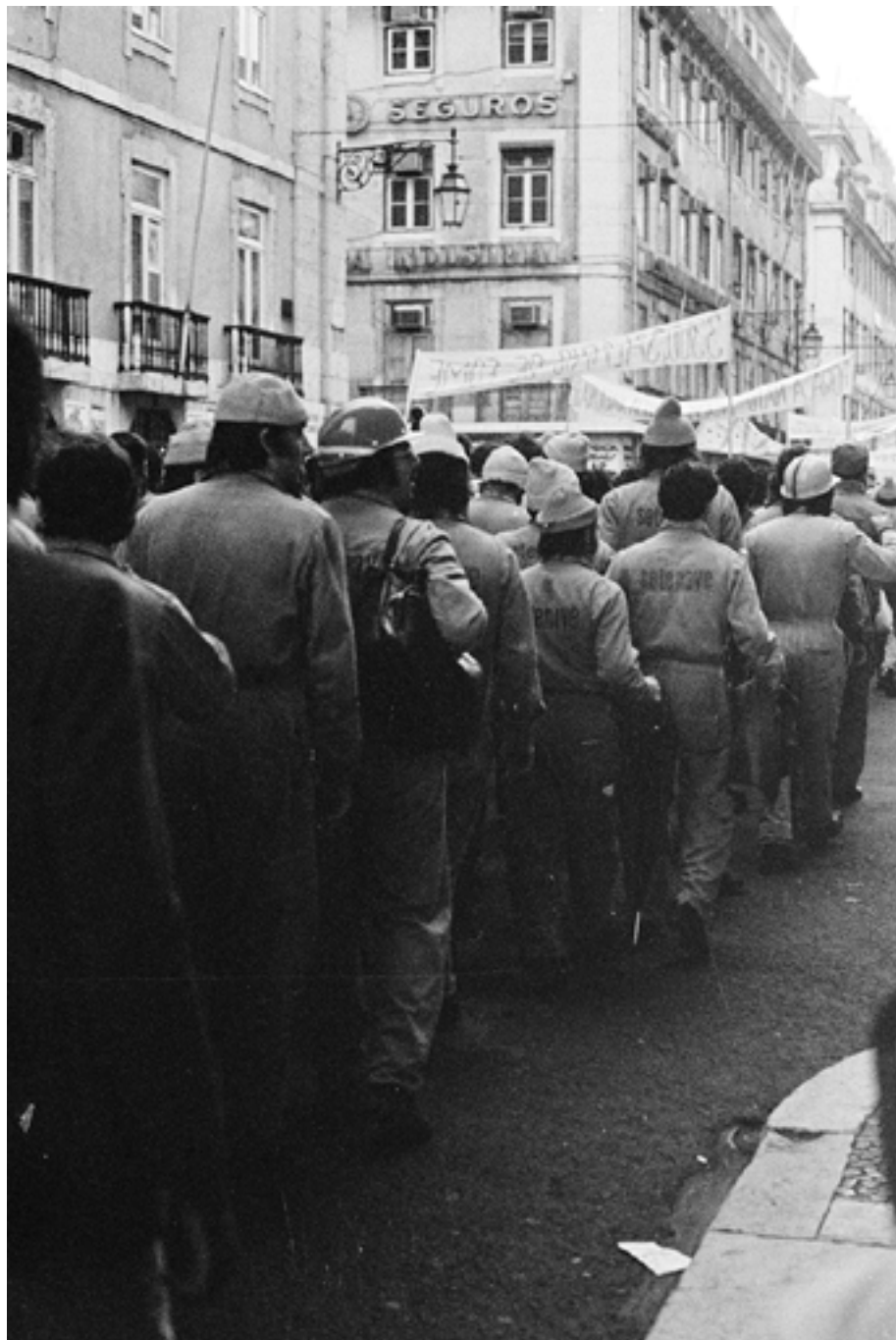
Figura 46 Manifestação operária contra o desemprego. Negativo de gelatina e prata em acetato de celulose.

Rua Augusta (Lisboa), 1975-07-02. Luis Pavão (1954-). PT/AMLSB/LUP/000002