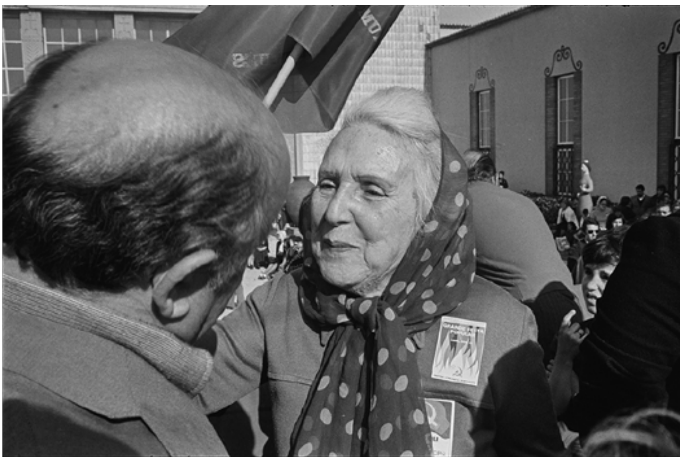
Figura 28 [Maria Lamas na Festa Popular do Partido Comunista Português]. Negativo de gelatina e prata em acetato de celulose, 35mm em tira. Belém (Lisboa), 1975-04-13.