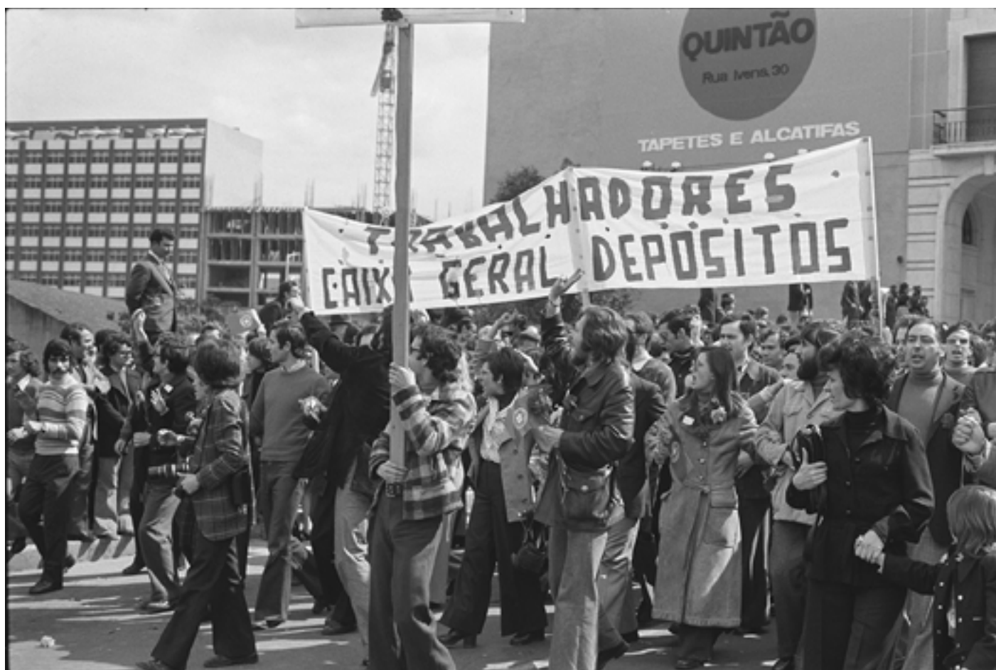
Figura 16 1.º de Maio de 1974: [trabalhadores da Caixa Geral de Depósitos]. Negativo de gelatina e prata em acetato de celulose, 35mm em tira.

Praça Francisco Sá Carneiro (Lisboa), 1974-05-01. António Sampaio Teixeira (1911-1998). PT/AMLSB/SAM/000790