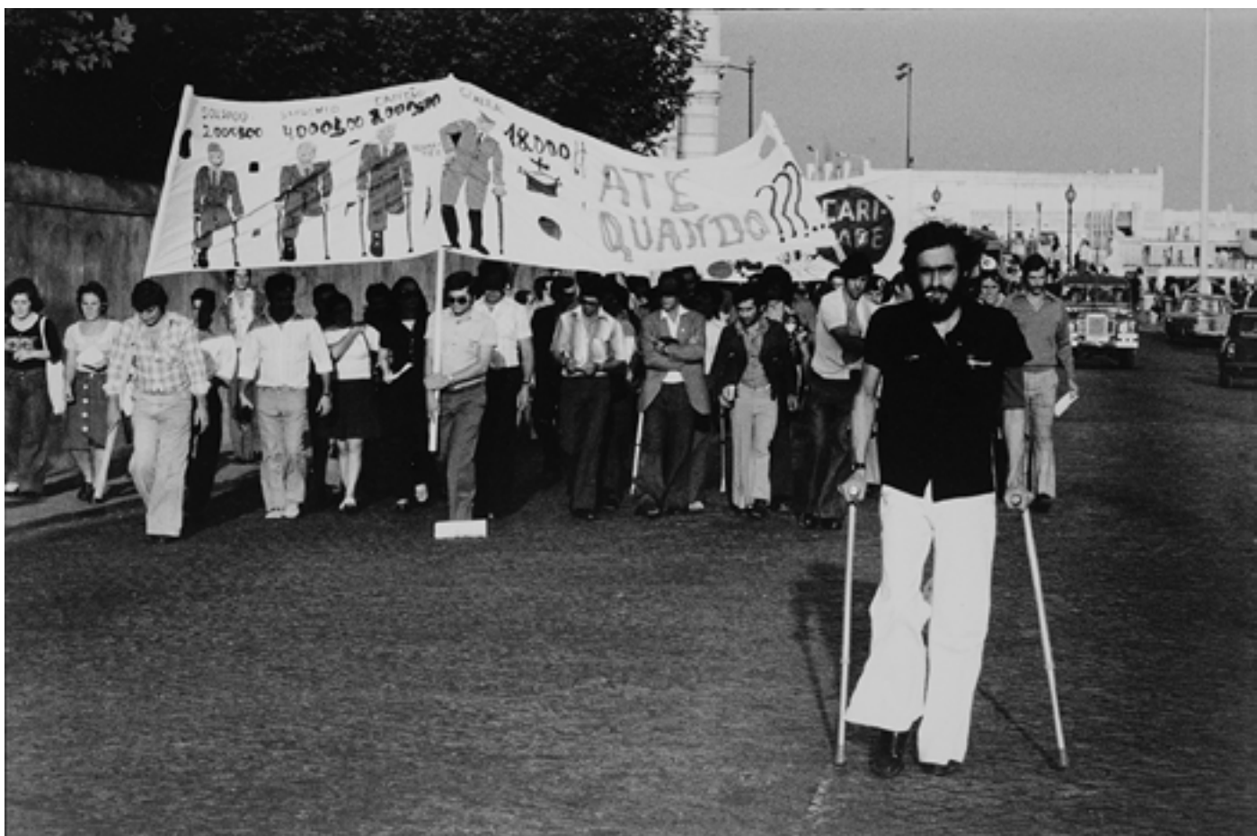
Figura 17 A força justa das vítimas de uma guerra injusta. Prova em papel de revelação baritado, 20x30cm.

Terreiro do Paço (Lisboa), [1975-09-20]. Carlos Gil (1937-2001). PT/AMLSB/CAR/000037