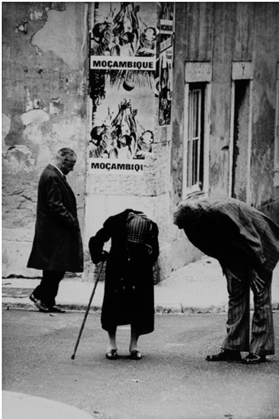
Figura 18 [Idosos]. Prova em papel de revelação baritado, 20x30cm.

Lisboa, [197-]. Carlos Gil (1937-2001). PT/AMLSB/CAR/000031