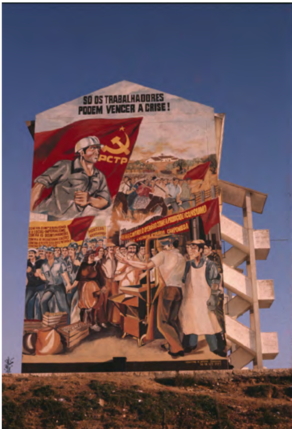
Figura 42 Propaganda política do PCTP na parede lateral de um prédio. Diapositivo de gelatina e prata em acetato de celulose, 35mm.

Avenida Marechal Gomes da Costa (Lisboa), 1977. José Neves Águas (1920-1991). PT/AMLSB/NEV/01/001053