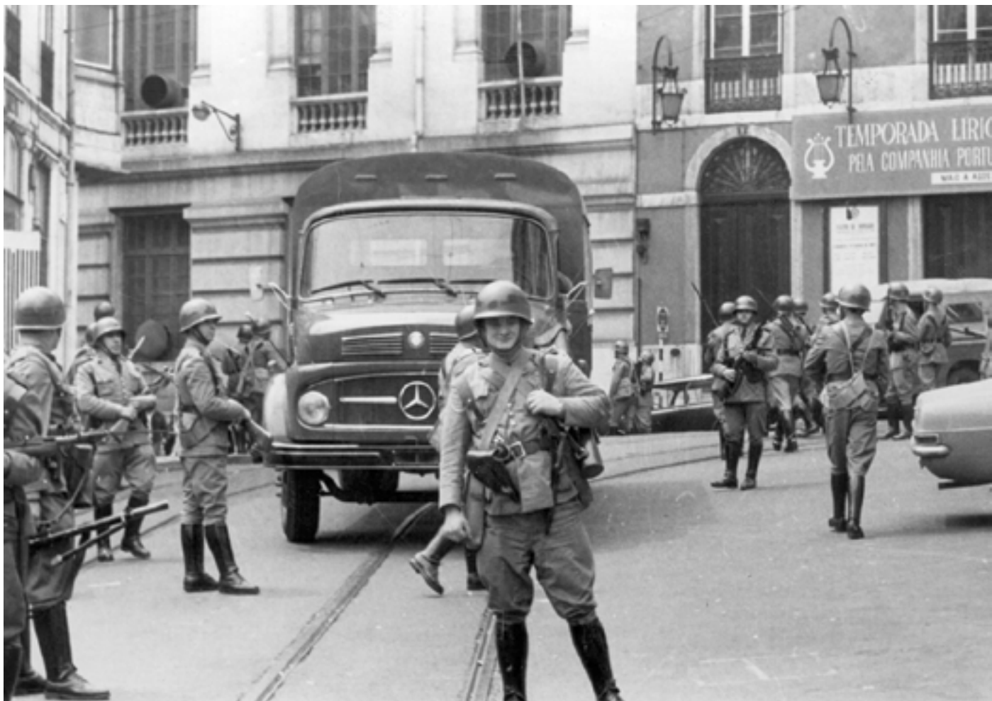
Figura 19 Revolução de 25 de Abril de 1974. Prova em papel de revelação baritado, 12,5x17,5cm.

Rua da Trindade (Lisboa), 1974-04-25. Jornal Diário de Notícias . PT/AMLSB/CMLSBAH/PCSP/004/JDN/000110