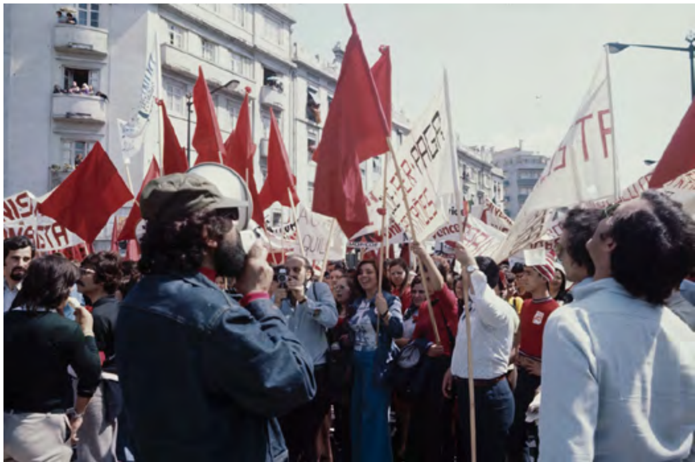
Figura 39 [Manifestação política com Ernesto de Sousa a filmar] . Diapositivo cromogéneo em acetato de celulose, 35mm (caixilho).

Alameda Dom Afonso Henriques (Lisboa), [post. 1974]. José Ernesto de Sousa (1921-1988). PT/AMLSB/ESO/001136