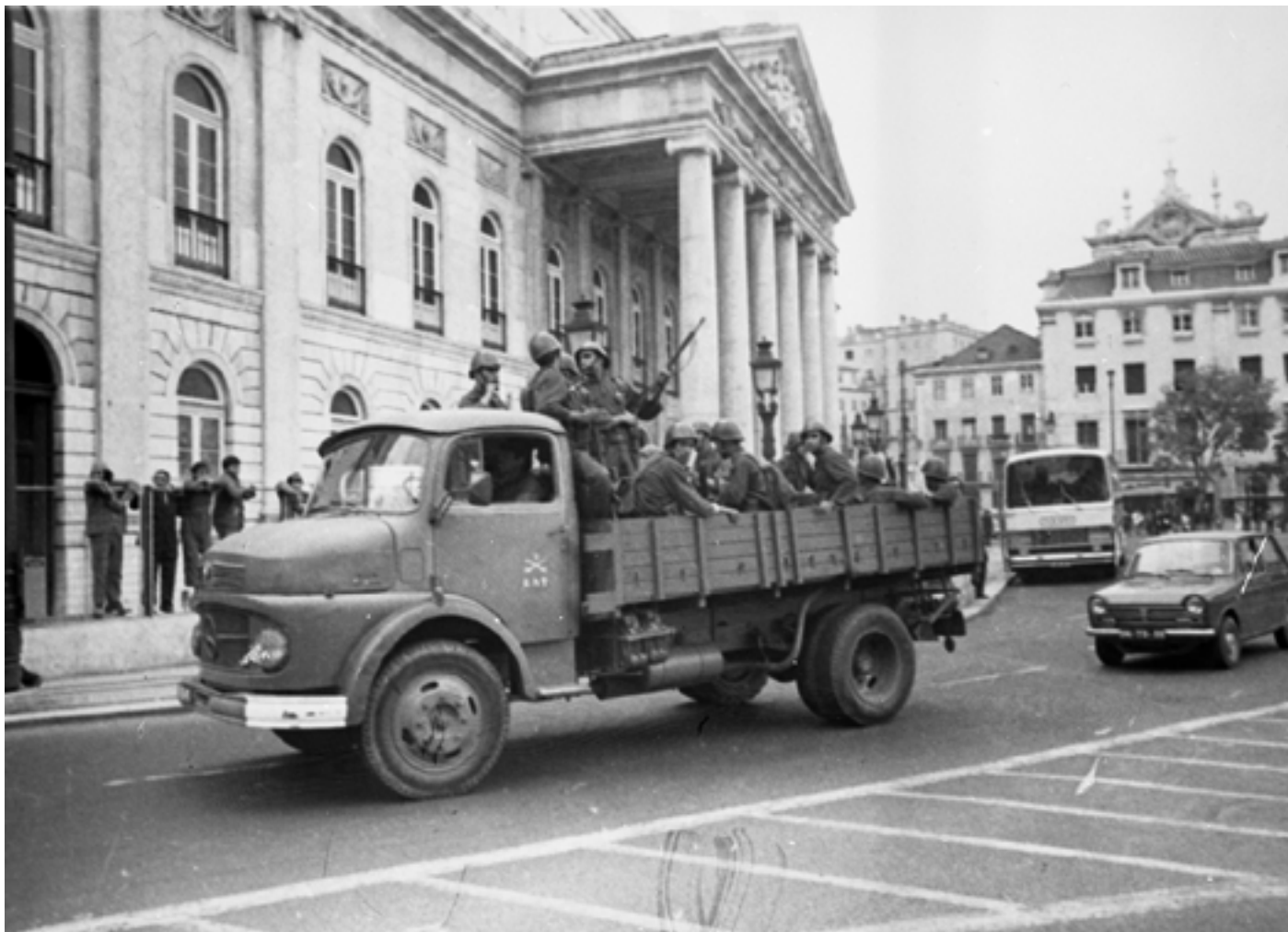
Figura 21 Revolução de 25 de Abril de 1974. Negativo de gelatina e prata em acetato de celulose, 6x7,5cm.

Praça de Dom Pedro IV (Lisboa), 1974-04-25. Jornal Diário de Notícias . PT/AMLSB/CMLSBAH/PCSP/004/JDN/000024