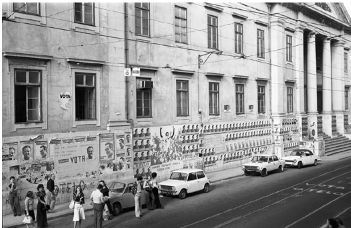
Figura 4 [Propaganda política na Faculdade de Ciências]. Negativo de gelatina e prata em acetato de celulose, 6x9 cm.

Rua da Escola Politécnica (Lisboa), 1976. Álvaro Campeão (s.d.). PT/AMLSB/CMLSBAH/PCSP/004/CAM/000025