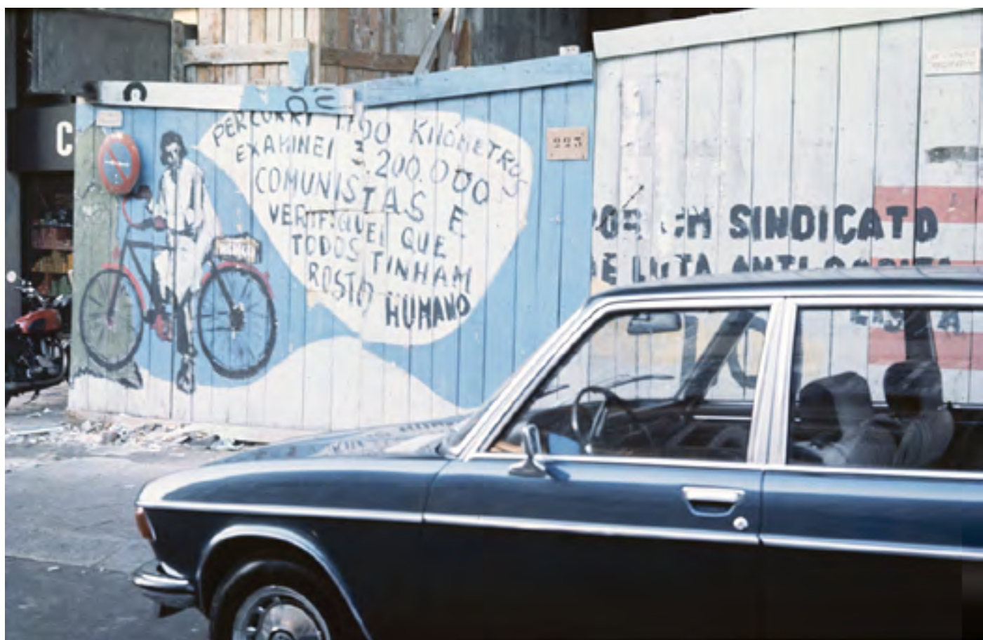
Figura 40 [Propaganda política: mural]. Diapositivo cromogéneo em acetato de celulose, 35mm (caixilho).

Lisboa, [post. 1974]. José Ernesto de Sousa (1921-1988). PT/AMLSB/ES0/001083