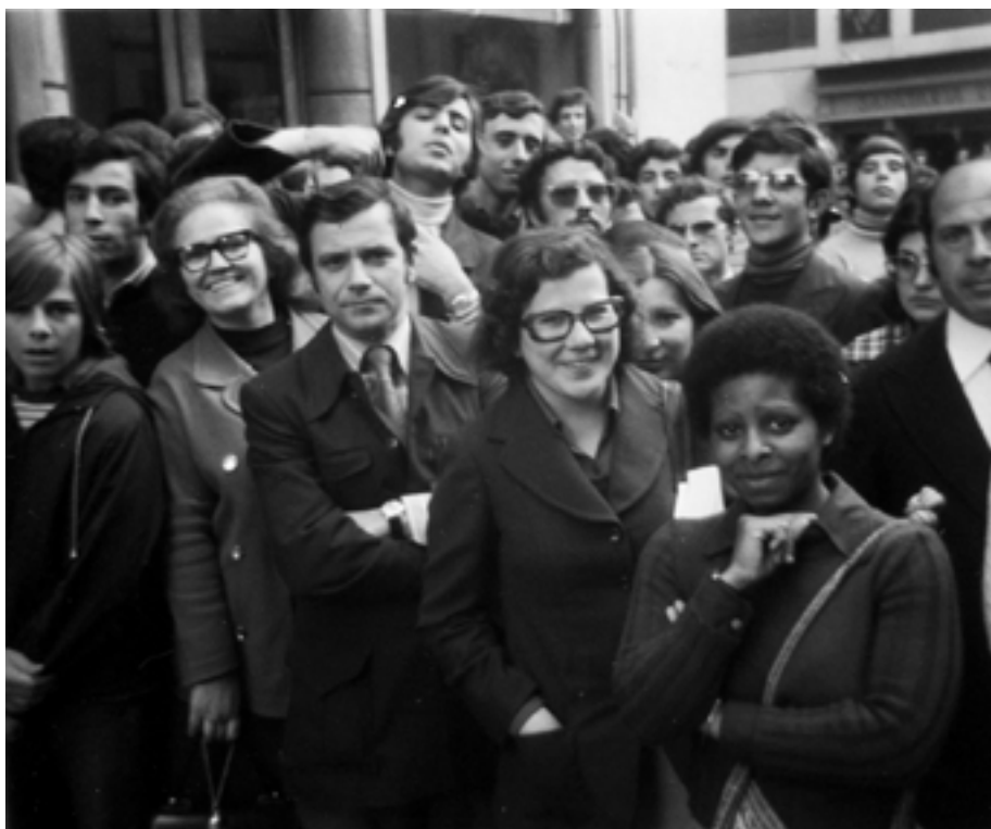
Figura 9 [25 de Abril de 1974: populares na rua]. Negativo de gelatina e prata em acetato de celulose, 126 mm. Rua Garrett (Lisboa), 1974-04-25. Ana Hatherly (1929- 2015). PT/AMLSB/ANA/000184