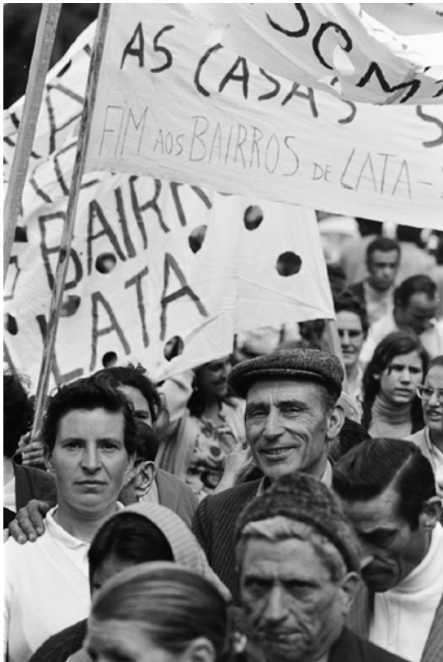
Figura 47 Manifestação casas sim barracas não, fim aos bairros da lata. Negativo de gelatina e prata em acetato de celulose. Parque Eduardo VII (Lisboa), 1975-06. Luis Pavão (1954-). PT/AMLSB/LUP/000003