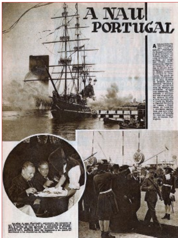
Figura 2 Página da revista O Século Ilustrado figurando a inauguração da Nau Portugal . Salazar e o cardeal Cerejeira são servidos a bordo da Nau . O Século Ilustrado . Nº 141 (14 setembro 1940), p. 9.

Numa primeira e única referência à talha, que adornava exteriormente a nau, refere que a mesma foi esculpida por mestre Abraão de Carvalho, natural do Porto.