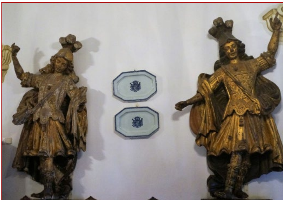
Figura 12 Par de esculturas de vulto com atributos de Santiago. Palácio dos marqueses da Fronteira. Lisboa.