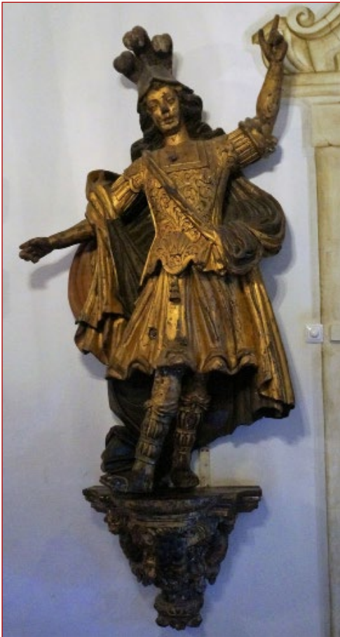
Figura 14 Escultura de vulto com atributos de Santiago. Palácio dos marqueses da Fronteira. Lisboa.

A Nau , mais do que um objeto concreto, foi uma ideia que transbordou as fixas categorias da realidade. Momento cénico por excelência, a vivência do espírito pleno da Nau pretendia projetar o visitante para um tempo glorioso,