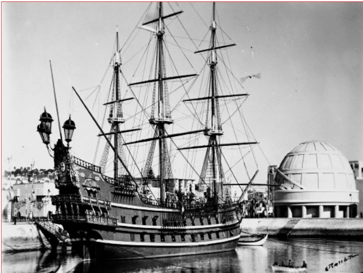
Figura 4 Comemorações do Duplo Centenário: exposição do Mundo Português. Vista da Nau Portugal. Eduardo Macedo Portugal, 1940. AML, PT/AMLSB/CMLSBAH/PCSP/004/EDP/001550.

os trâmites pelos quais se regeram, quer esses mesmos empréstimos, quer posteriormente as ações e condições de devolução das peças cedidas.