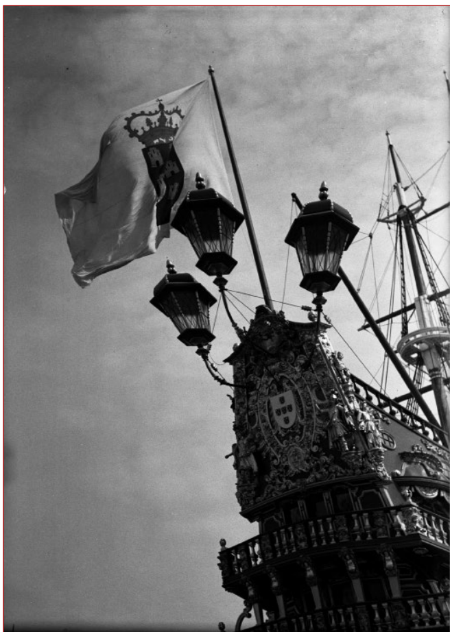
Figura 8 CUNHA, Comemorações do Duplo Centenário: exposição do Mundo Português. Nau Portugal . Pormenor da proa. Álvaro Ferreira da Cunha, 1940. AML, PT/AMLSB/CMLSBAH/PCSP/004/FEC/000244.