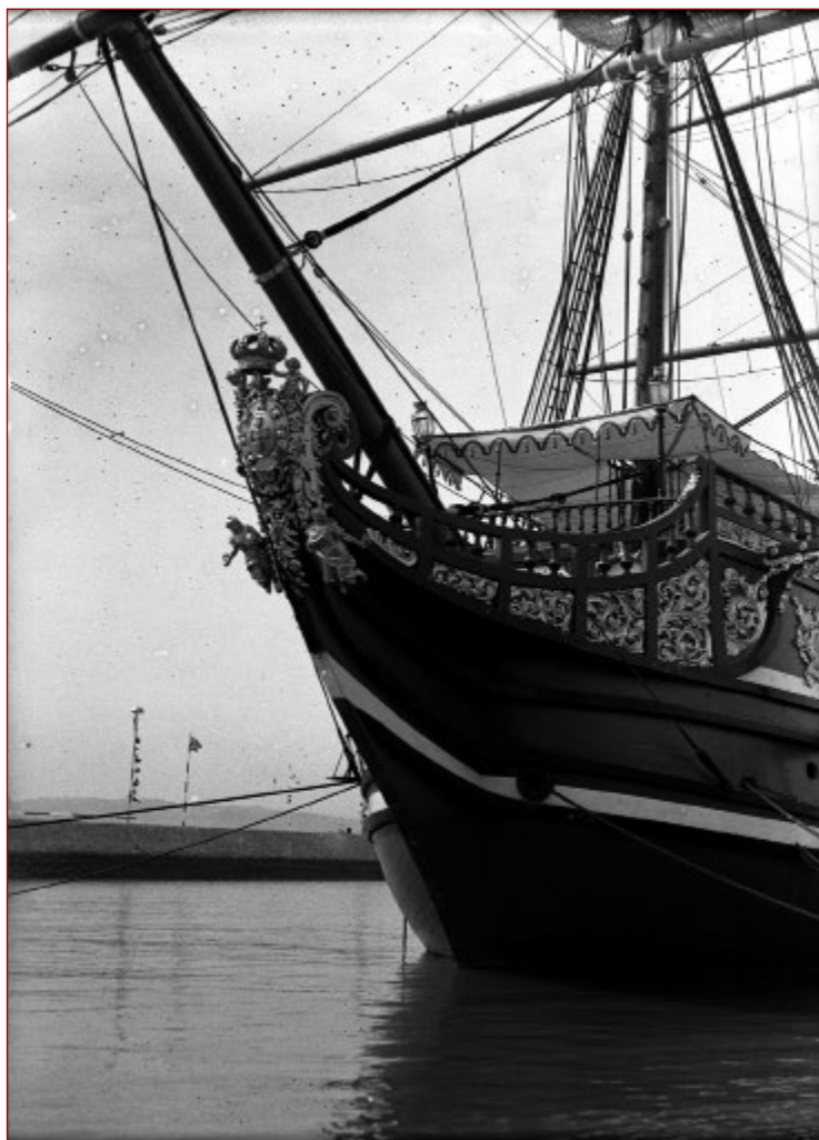
Figura 7 Comemorações do Duplo Centenário: exposição do Mundo Português. Vista da popa da Nau Portugal . Álvaro Ferreira da Cunha, 1940. AML, PT/AMLSB/CMLSB/PCSP/004/FEC/000247.

Encerrada a Exposição do Mundo Português , a 2 de dezembro de 1940, a Nau Portugal continuou atracada em Belém, esperando um destino condigno. No entanto, a 15 de fevereiro do ano seguinte, Portugal é assolado por um violento ciclone que devastou várias cidades do país. Lisboa não foi exceção e a Nau Portugal , ancorada em Belém, não escapou à violenta ação do fenómeno atmosférico. O Jornal O Século destacou na sua primeira página de 16 de fevereiro de 1941, o terrível ciclone que afetou Portugal, causando vítimas e avultados prejuízos materiais, salientando precisamente os efeitos devastadores que teve na Nau .