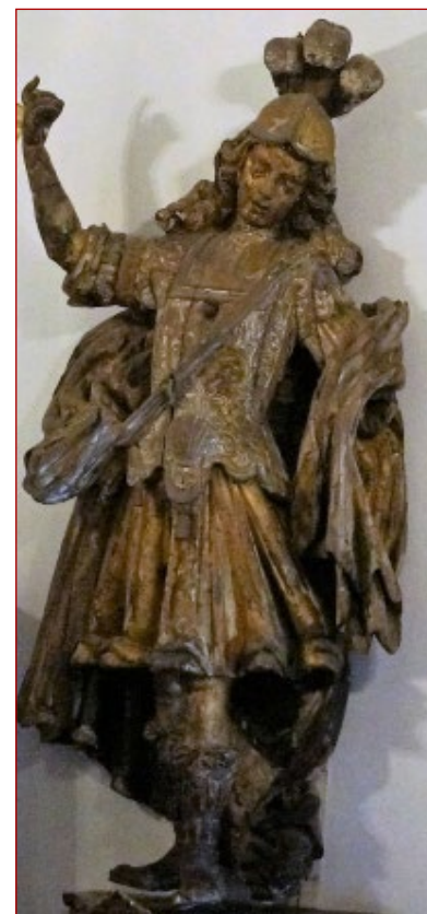
Figura 13 Escultura de vulto com atributos de Santiago. Palácio dos marqueses da Fronteira. Lisboa.