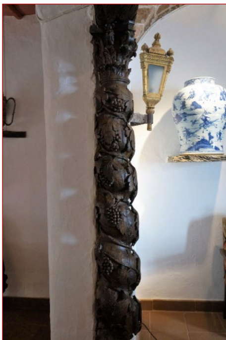
Figura 10 Coluna torsa em madeira com cachos de uvas e folhas de videira. Sala Casa Monsaraz.