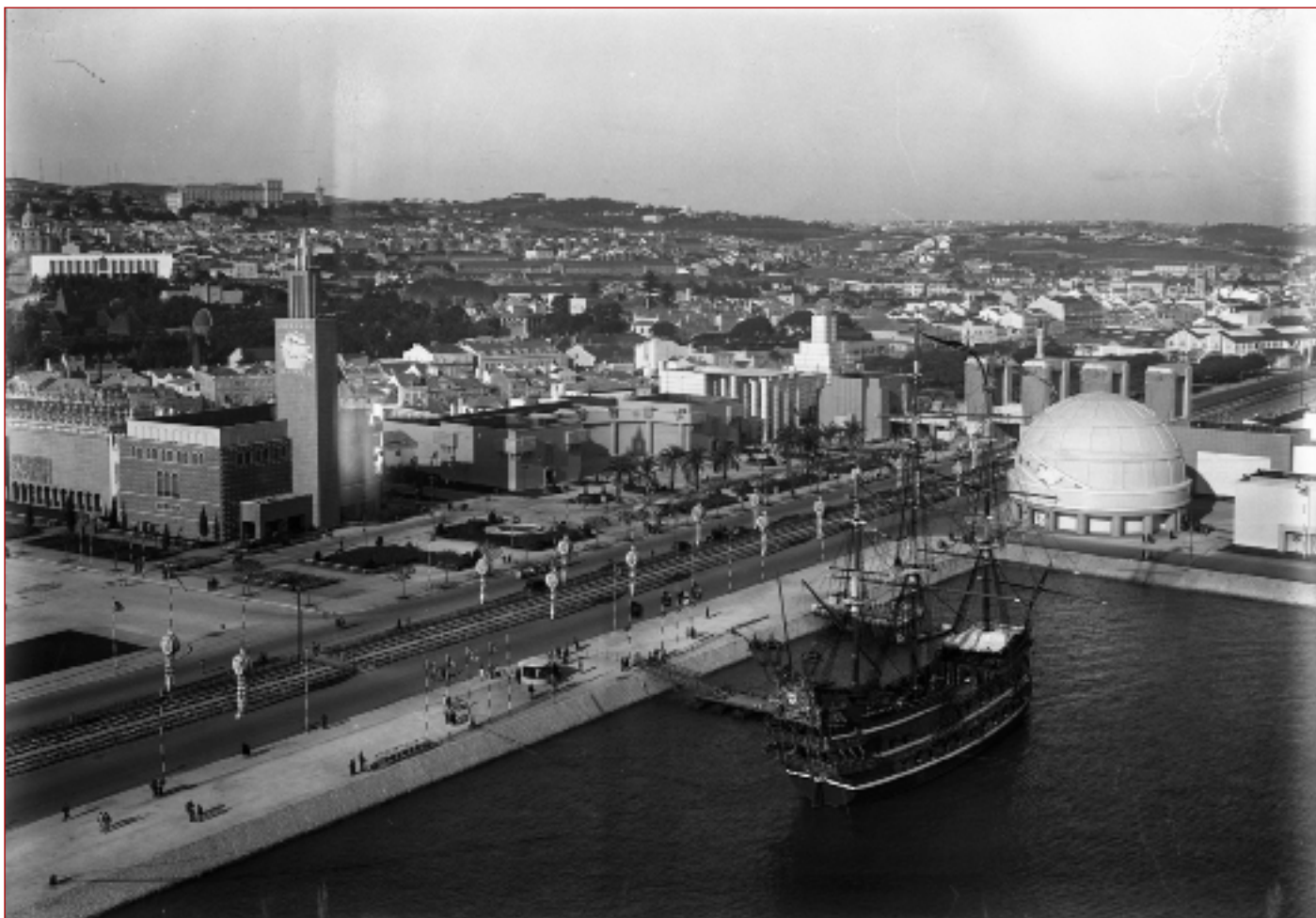
Figura 1 Comemorações do Duplo Centenário – Exposição do Mundo Português. Vista panorâmica da Exposição do Mundo Português com a Nau Portugal ancorada no Tejo. Paulo Guedes, 1940. Arquivo Municipal de Lisboa (AML), PT/AMLSB/CMLSB/PCSP/004/PAG/000356.

Um dos relatos mais contristados sobre o desastre teve por autor, o então arcebispo de Aveiro, D. João Evangelista Vidal que, no dia seguinte ao incidente, escreve: