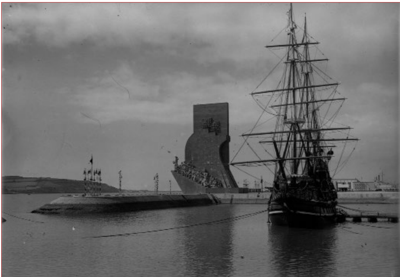
Figura 3 Comemorações do Duplo Centenário: exposição do Mundo Português. Nau Portugal tendo como fundo o monumento efémero Padrão dos Descobrimentos. Paulo Guedes, 1940. AML, PT/AML SB/CMLSBAH/PCSP/004/PAG/000385.

Sobre essa cedência, João Couto tece várias considerações, que expõe sucintamente em cinco pontos: