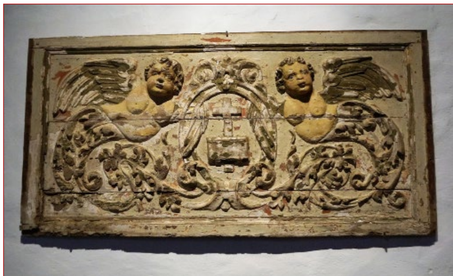
Figura 11 Paineis de talha com duas figuras híbridas. Sala Casa Monsaraz.

Uma das casas que pertenceu a António Júdice Bustorff Silva, e que visitámos, situa-se na vila de Monsaraz no Alentejo. O atual proprietário gentilmente aceitou mostrar-nos o espólio da casa e verificou-se a existência de várias peças de talha, nomeadamente um par de colunas torsas, que poderão ser oriundas do espólio da Nau 47 .