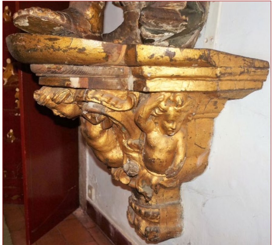
Figura 15 Peanha de escultura de vulto com atributos de Santiago. Palácio dos marqueses da Fronteira. Lisboa. Foto da autora.