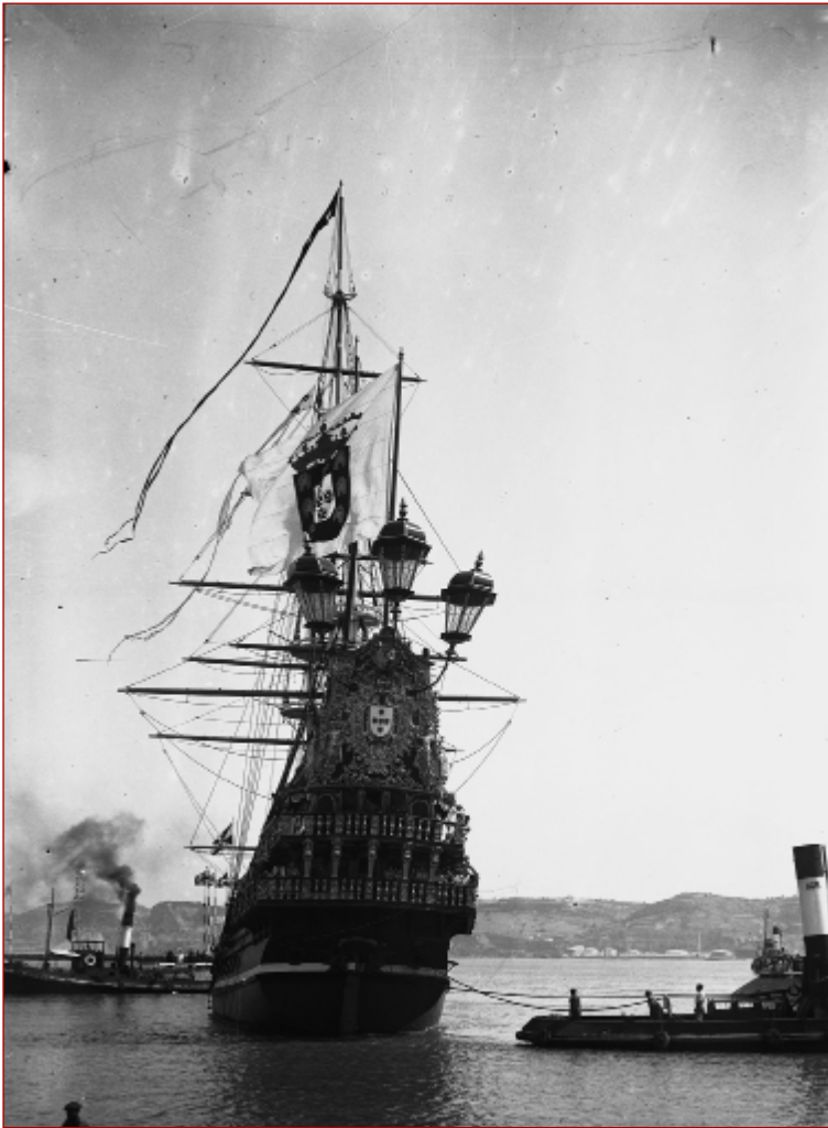
Figura 5 Comemorações do Duplo Centenário: exposição do Mundo Português. Nau Portugal vista de proa. Paulo Guedes, 1940. AML, PT/AMLSB/CMLSB/PCSP/004/PAG/000386.

a 2 de maio seguinte pela Direção Geral da Fazenda Pública. Nela se afirma que da construção dos interiores da referida embarcação não sobrou nenhuma talha e que, por tal, o pedido do pároco de Borba não poderia ser satisfeito 38 .